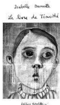
Le livre de Timothé Éditions Potentille