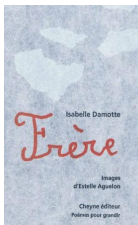
Frère Cheyne éditeur

Trois recueils de poèmes d'Isabelle Damotte